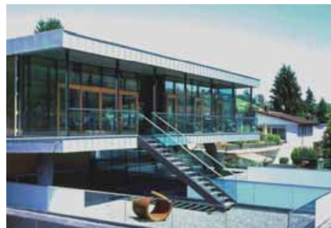
Wohnhaus in Küsnacht Foto 1 + 2