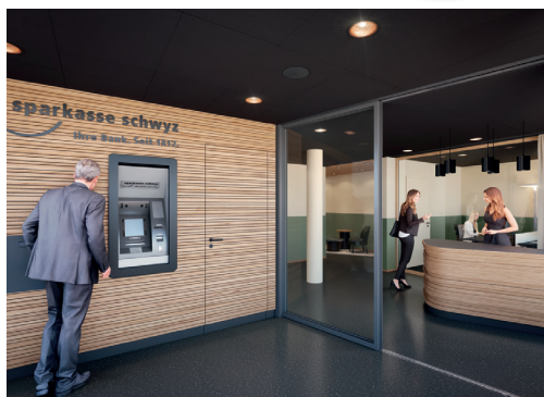
Die Sparkasse in Goldau hat neu eine 24-Stunden-Zone